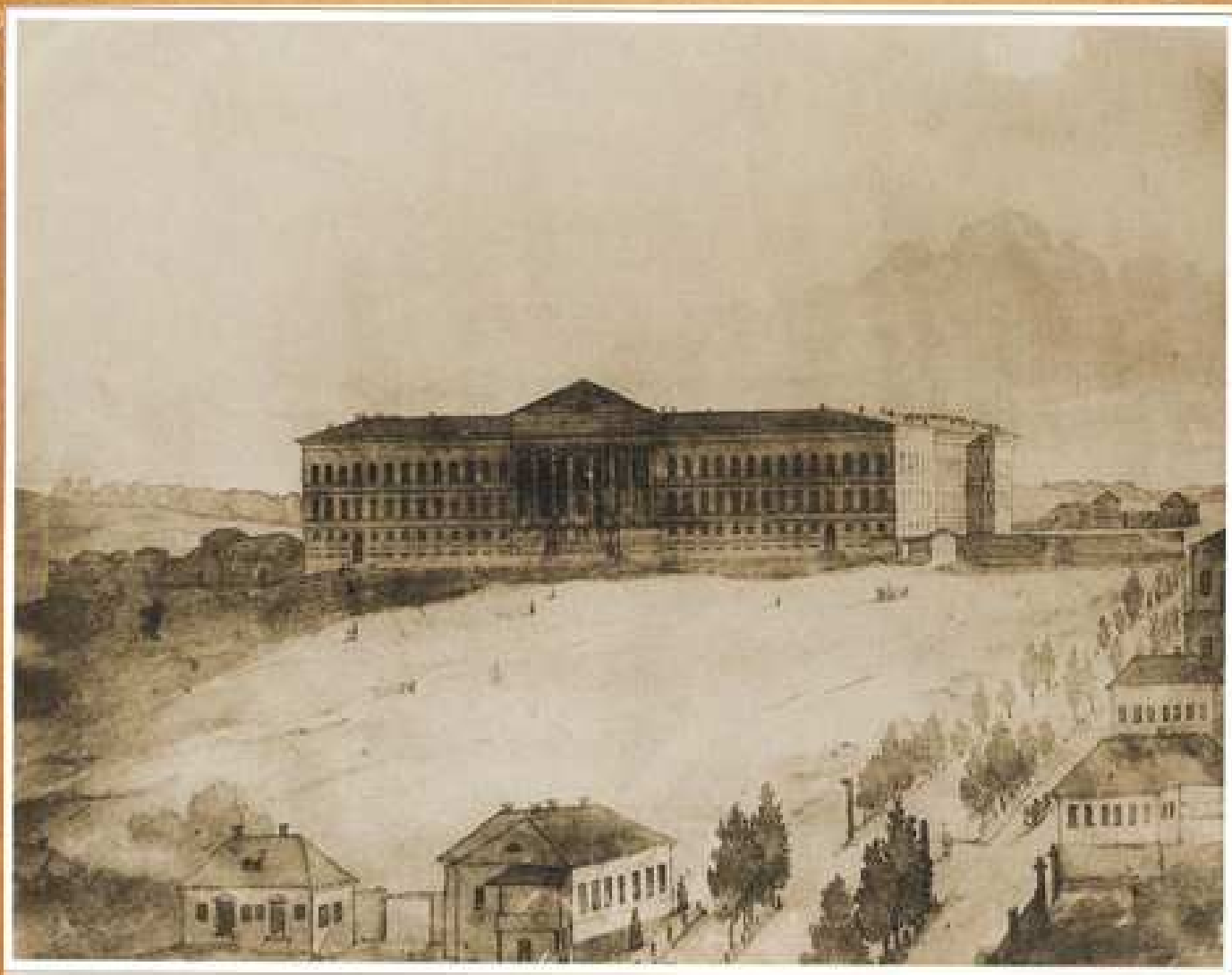
Університет Св. Володимира, 1846 папір, акварель