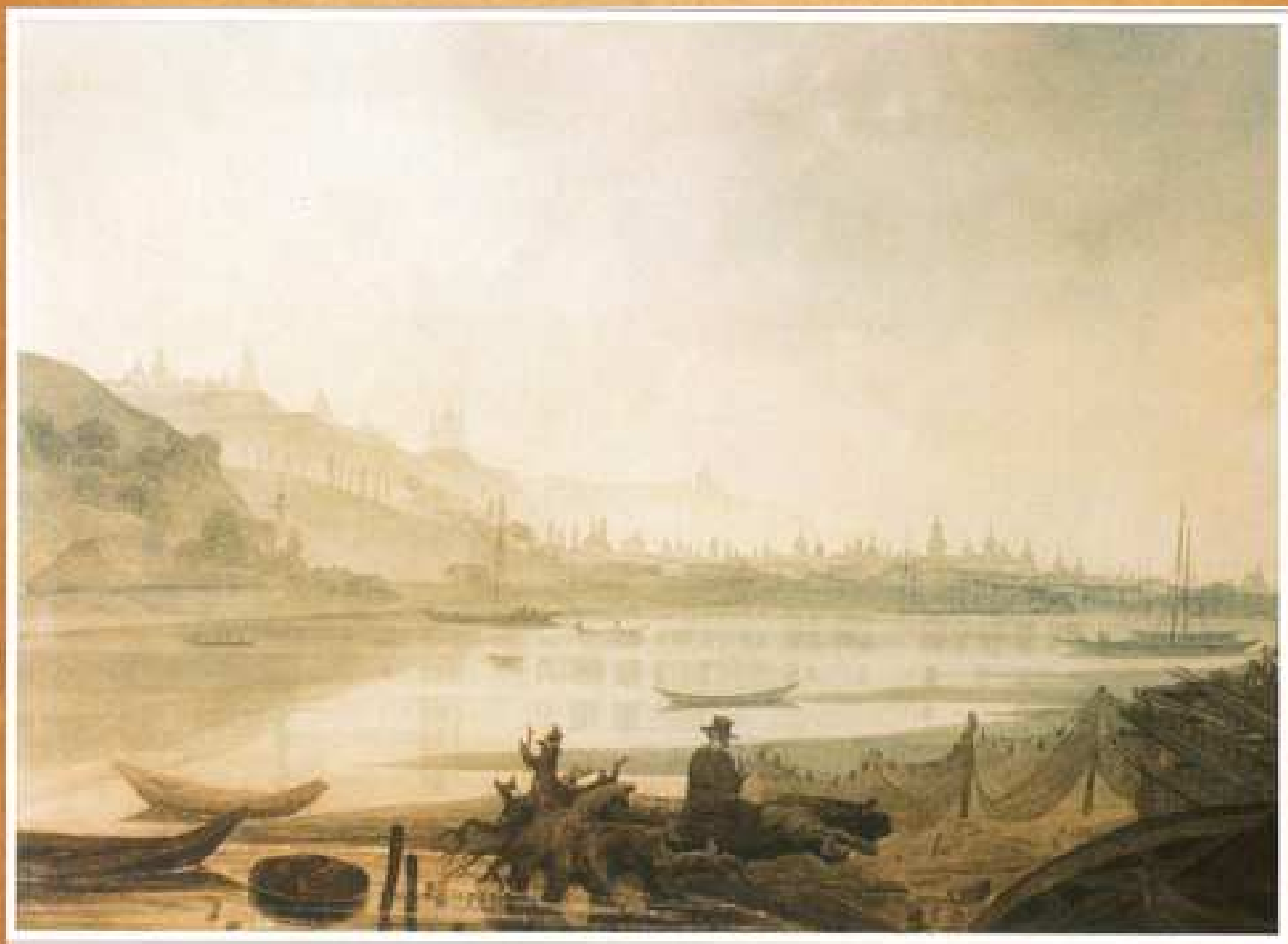
Київ з-за Дніпра, 1846