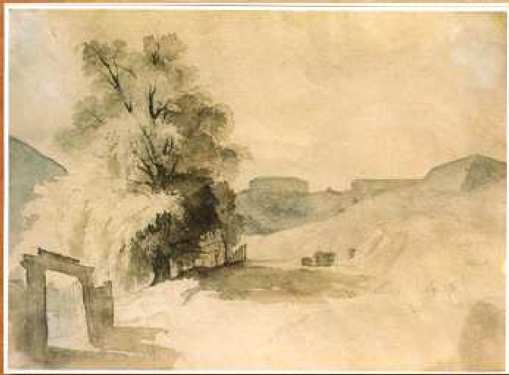
Васильківський форт у Києві, 1846 папір, акварель