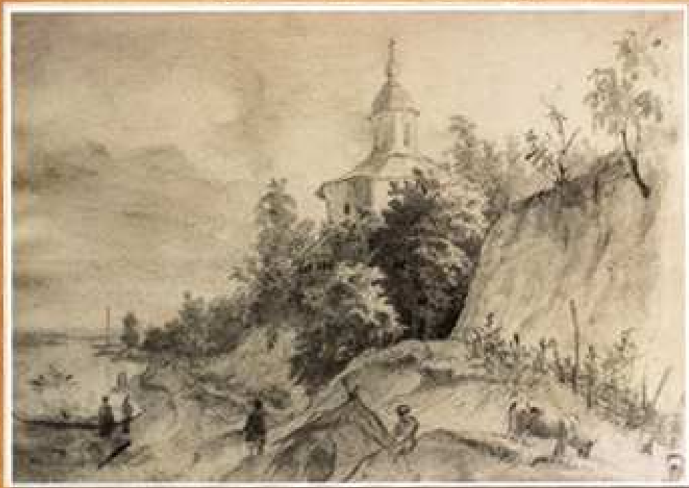
Рисунок з натури, використаний для офорта

Поруч назву повторено французькою мовою.