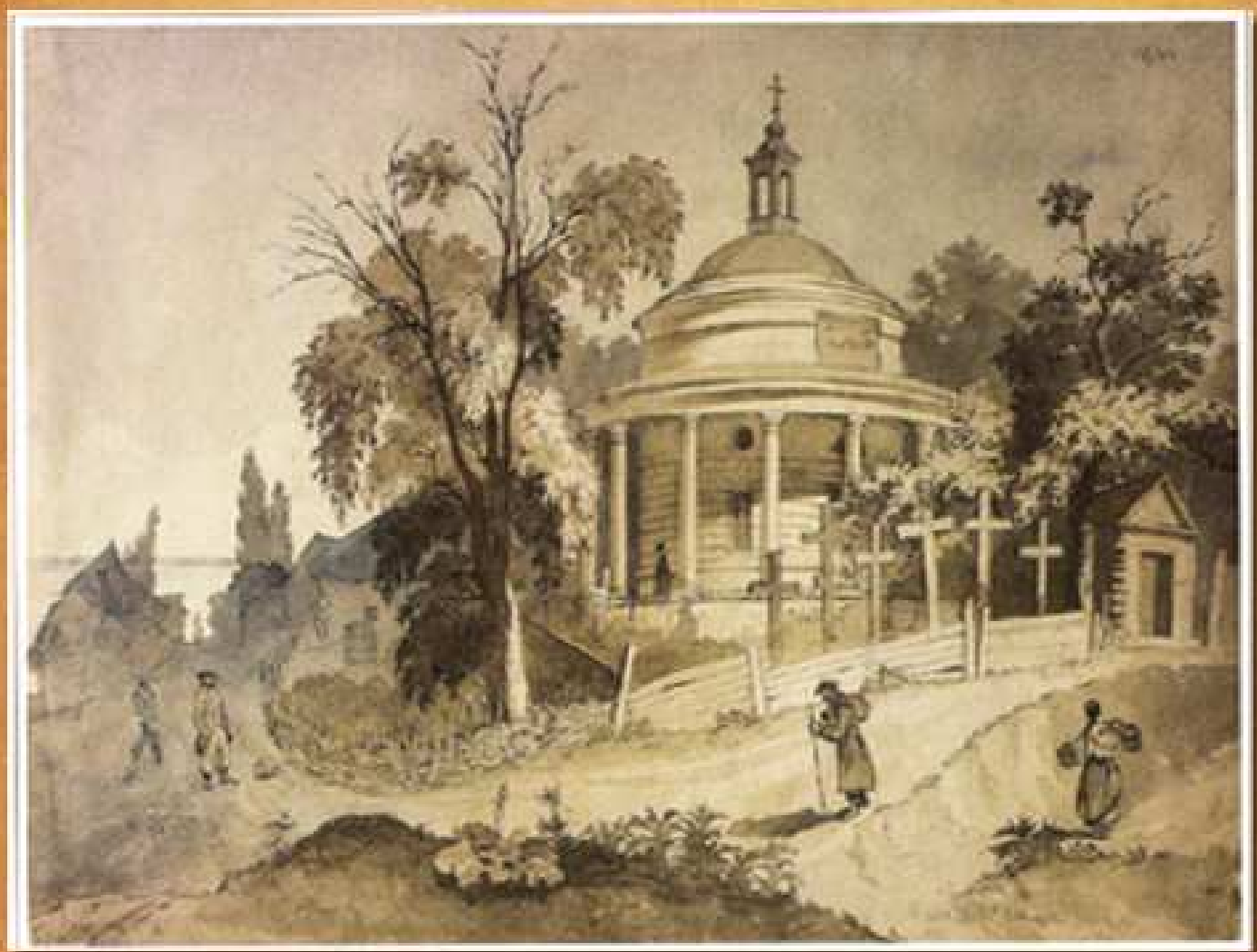
Аскольдова могила, 1846 папір, сепія, акварель