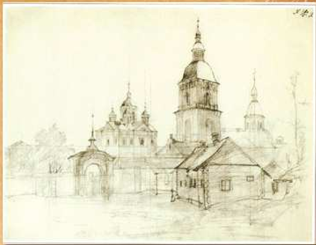
Києво-Межигірський монастир, 1843 папір, олівець