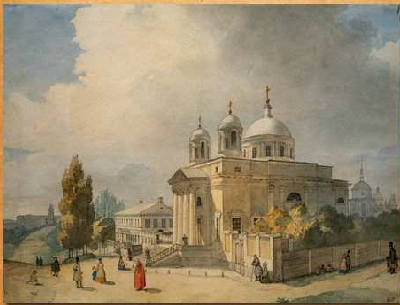
Костел Св. Олександра у Києві, 1846

Згодом Шевченко знайшов роботу в Київській археографічній комісії. Художникові довелося побувати у різних місцях України, де він змальовував й описував історичні пам'ятки. З часу його подорожей залишилось чимало акварелей, простих і природних за своїми сюжетами.