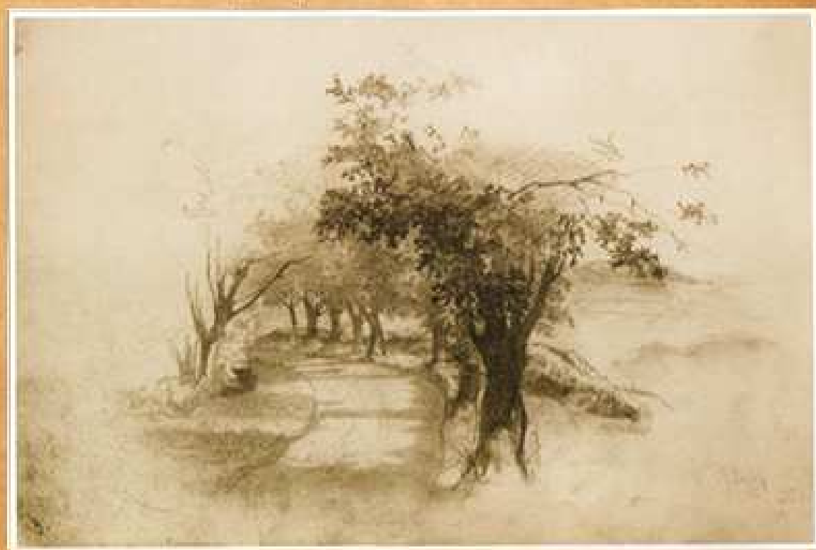
У Києві, 1843 папір, олівець