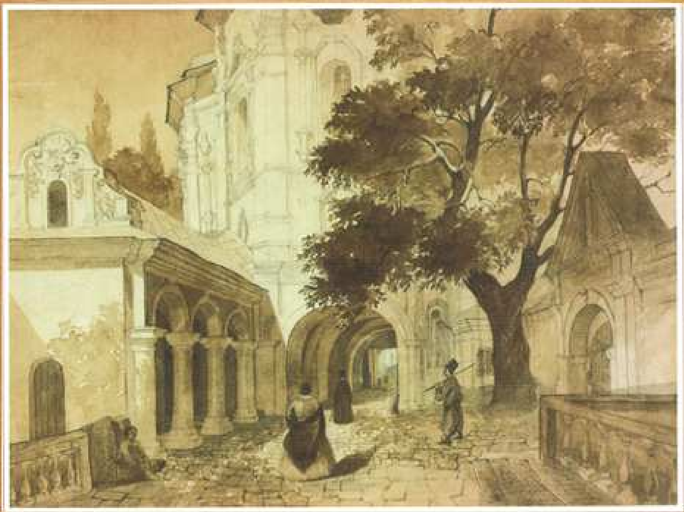
Церква Всіх Святих у Києво-Печерській Лаврі, 1846