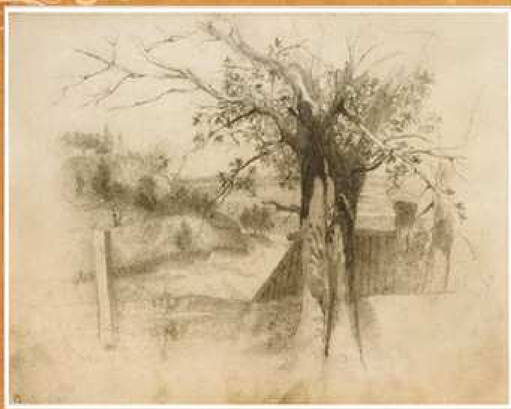
Михайлівська гора з боку Хрещатицького спуску, 1843