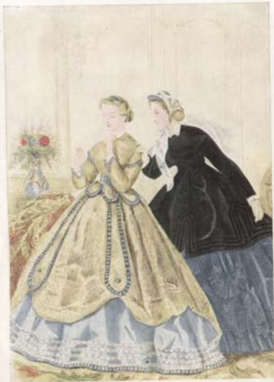
From Godley's Lady's Book , 1865