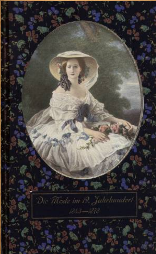
Die Mode im 19. Jahrhundert 1843—1878