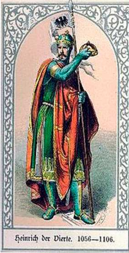
Heinrich der Vierte. 1056—1106.